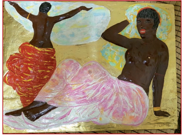
Salvatore Fiume: La perla dell'Ogaden

Perché, come diceva Giancarlo Menotti, l'arte è un grandissimo fenomeno di comunicazione, che ad ognuno di noi sta d'interpretare.